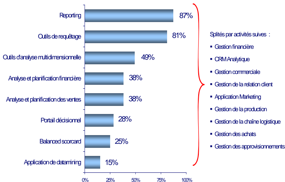
Les types d'outils décisionnels déployés fin 2006